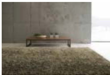
ラグマット・こだわりの素材より スミロンマルチシャギー