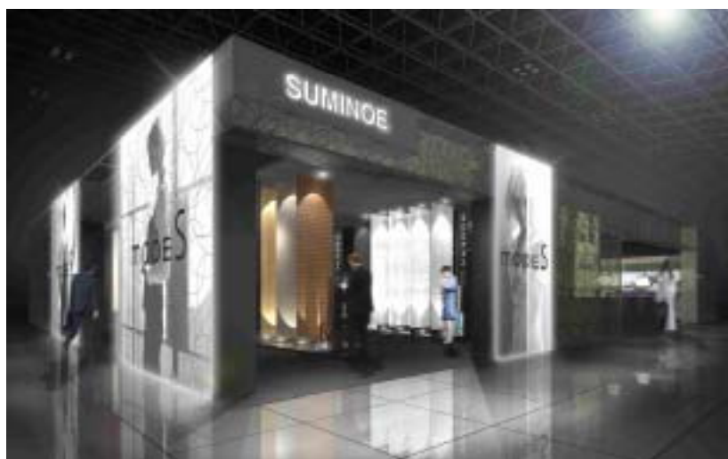
スミノエのブースイメージ