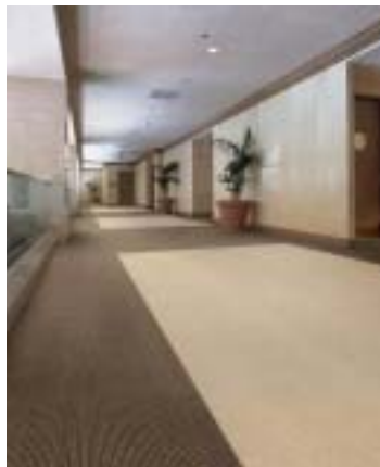
カーペットコンシェルジュより グッドデザインを受賞した ウールリンクス4000