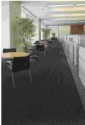
リサイクルタイルカーペット スミグリーンSG-300

また、9月1日に新発売しました「ビッグサイズ ラグ&ピースカーペット VOL.3」シリーズならびに「ホームラグマット&ワールドノーペットコレクション 2006-2007」の中から、人気の高いこだわりの素材シリーズから遊び毛の出にくい「スミトロンスタイル」の他、様々なテクスチャーのラグ等を展示いたします。