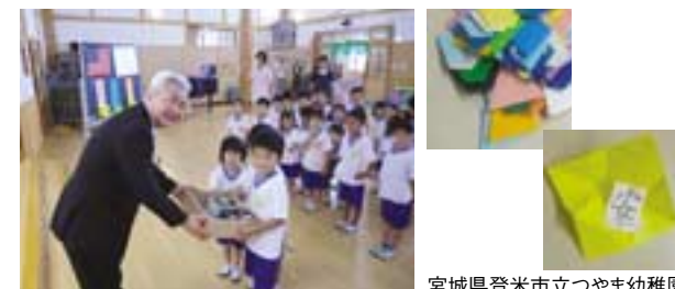
宮城県登米市立つやま幼稚園

東日本大震災のニュースを見て、Suminoe Textile of America Corporation (STA) の近くにあるグラッシー・ボンド小学校では生徒全員で折り紙のお守りを作り、募金集めをしました。お守りは美術の先生が折り方を教え、子供たちのアンケートで選ばれた、希望Hope・安らぎPeace・愛Loveという3つのメッセージが入れられました。STAはサウスカロライナ州ガフニー市で唯一の日系企業というご縁もあり、この折り紙と募金をお預かりし、折り紙は宮城県登米市立柳津小学校・横山小学校・つやま幼稚園に、募金は登米市役所に義援金としてお届けしました。